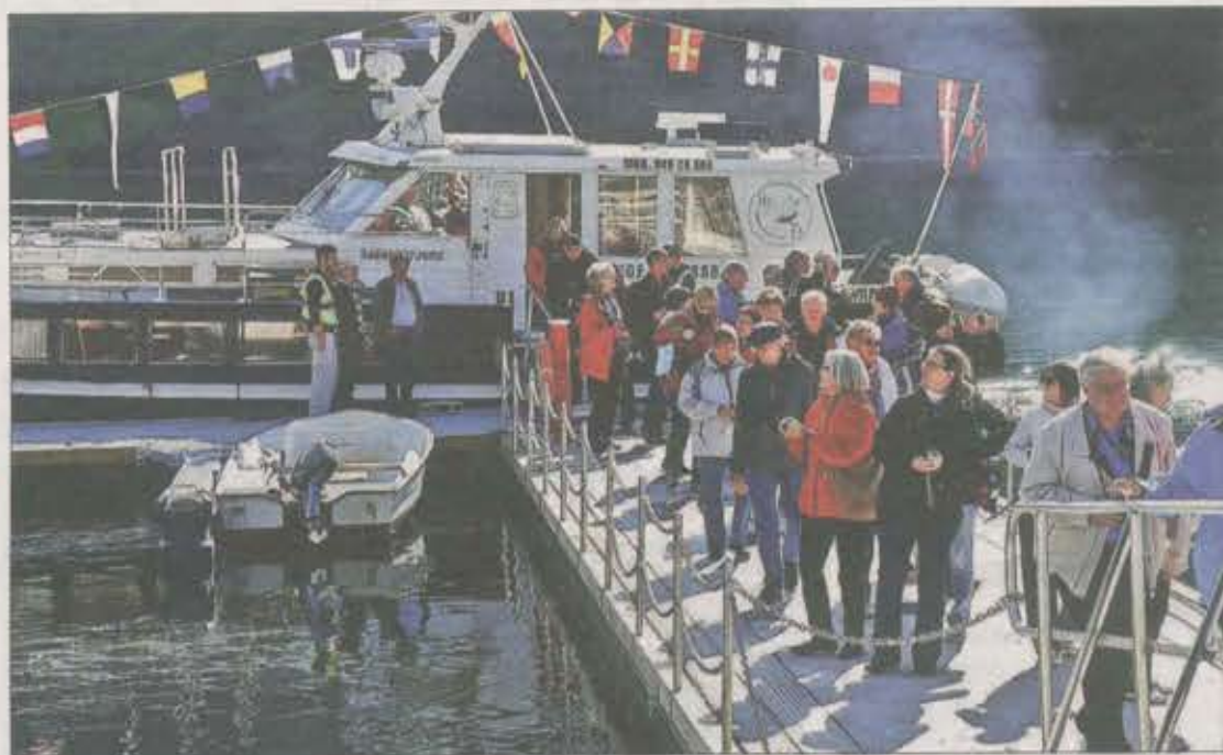
Passasjerane fann fram fotoapparata med det same dei kom i land.

I tillegg kjem dei indirekte inntektene, som kundar i lokalbutik-