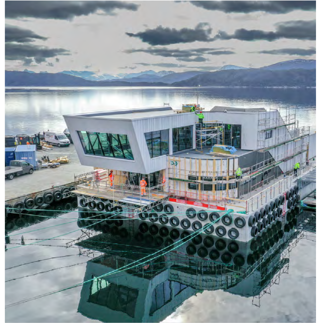
Overbygget er over to etasjer. Første etasje skal brukes til drift, mens andre etasje er besøkssenter. Flåten overleveres 2. kvartal 2022.