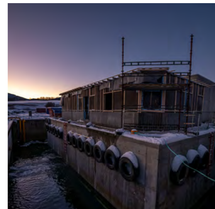
Sjøsetting av forflåte MS-600-01-21 ved tørrdokken i Kyrksæterøra. I denne tørrdokken kan det produseres flåter som er opptil 37 meter lang og 21 meter bred.