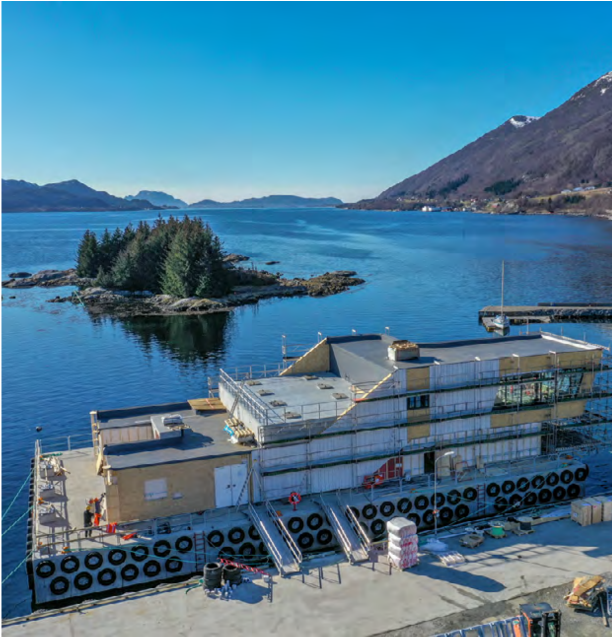
Skroget til flåten er 36 x 20 m og bygget hos Endúr Sjøsterk AS i Bergen. Den er slept til ei kai utenfor Ålesund hvor den utrustes av K. Nordang AS.